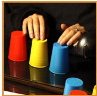
Photos: @susanmacwilliam, Derris Optics, 2006. A Video / Video: '9', Courtesy of the artist and GONNERMITH

@Q21_vienna Instabil des Monats / Insta picture of the month